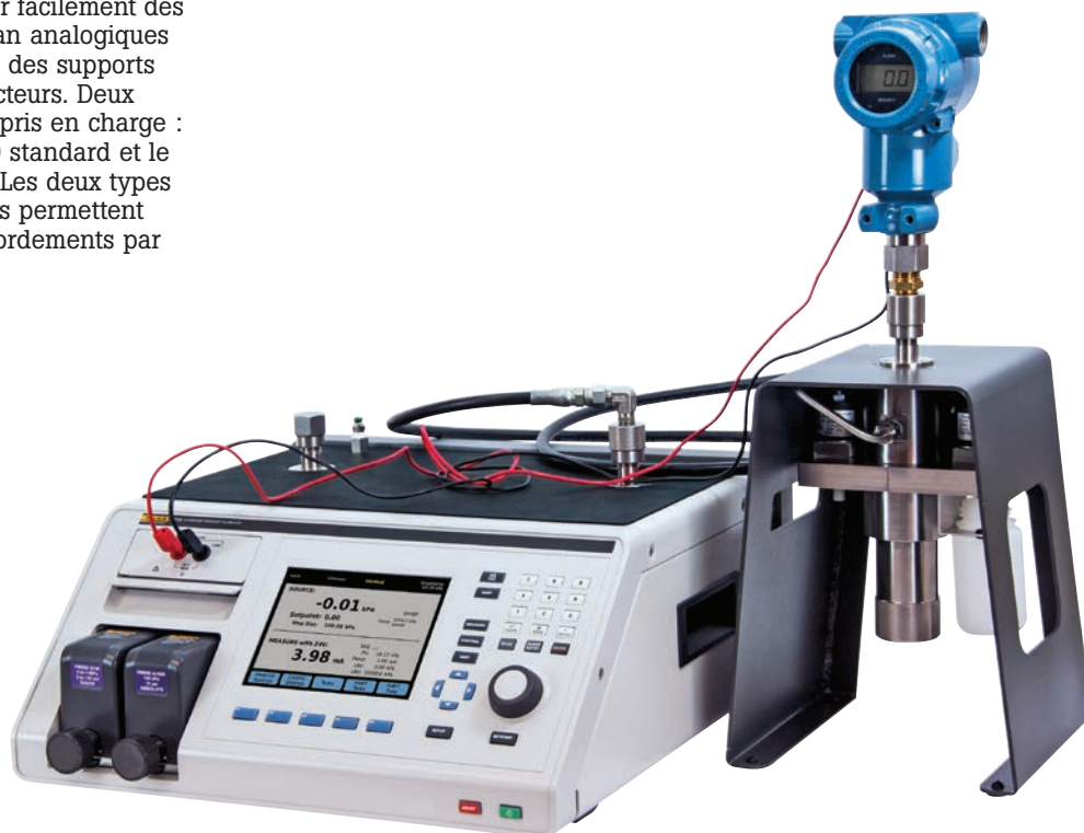
Le système de prévention de contamination assure la propreté des valves du 2271A et les protège des débris.

Le système de prévention de contamination offre un niveau inégalé de protection en assurant un débit unidirectionnel à l'écart du contrôleur, un système de collecte gravitaire et un système de filtre à deux niveaux.