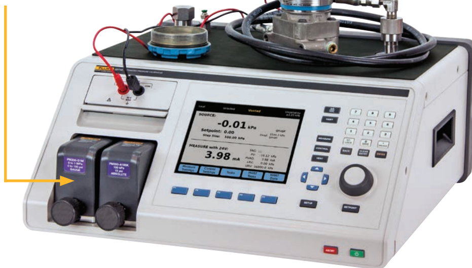
使用 2271A 对 4-20 mA 设备（例如该变送器）进行闭环、全自动校准。