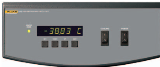
Unser proprietärer Temperaturregler ist das Geheimnis hinter einer hervorragenden Stabilität von \pm 0,0001\text{ °C} .

Wenn sich Ihre Anforderungen mithilfe unserer Standardgrößen und Temperaturbereiche nicht erfüllen lassen, können wir für Sie auch ein zuverlässiges, qualitativ hochwertiges kundenspezifisches Bad herstellen. Wir haben zum Beispiel Bäder mit erheblichen Tankänderungen (höher, breiter oder tiefer), kundenspezifischen Temperaturbereichen, verschiedenen Höhen oder Formen und schnelleren Erwärmungs-/Abkühlungsgeschwindigkeiten gebaut. Wir haben Bäder gefertigt, die Fenster oder angepasste Abmessungen zur Aufnahme von speziellen Messwerkzeugen erforderten. Kein anderer Hersteller bietet kundenspezifische Kalibrierbäder – wir schon.