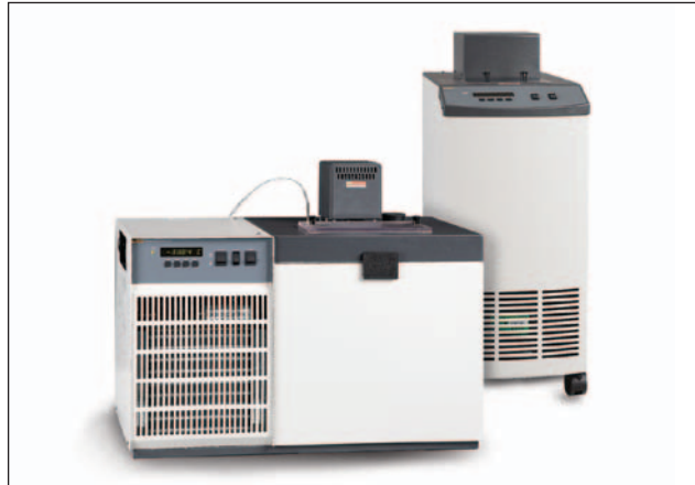
Fluke Calibration hat eine breite Palette von Kalibrierbädern im Angebot.

Wenn Sie auf die Stabilität eines Standard-Kalibrierbads verzichten können, sind Kompakt-Kalibrierbäder von Fluke Calibration die perfekte Alternative. Die Kompaktbäder haben einen geringeren Platzbedarf, weisen einen Temperaturbereich von -80\text{ °C} bis 300\text{ °C} und Stabilität im Bereich von 5-10 Millikelvin sowie schnellere Erwärmungs-/Abkühlzeiten als Standardbäder auf. Die Kompaktbäder mit großer Eintauchtiefe verfügen über